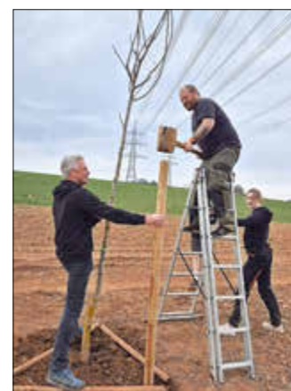
Beim Einschlagen der Pfähle war Treffsicherheit sehr wichtig