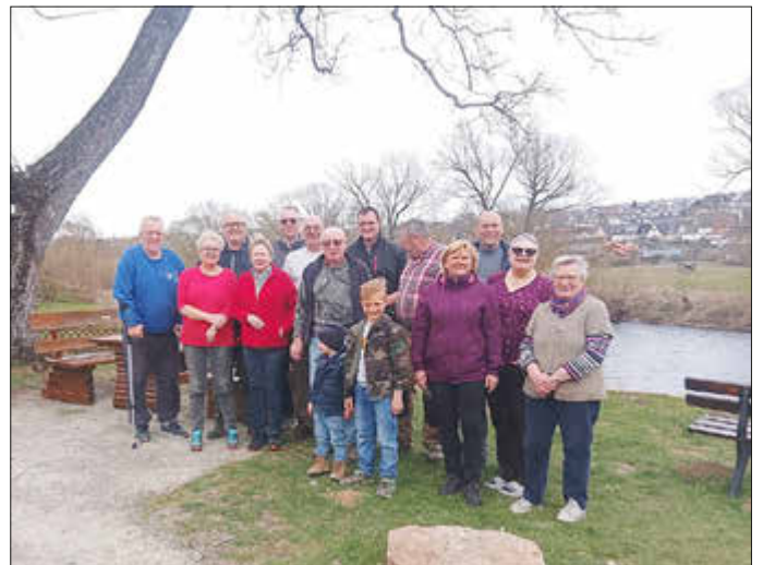
Bei der Beteiligung an solchen Aktionstagen sind die Lobenhäuser die Größten