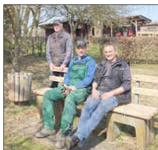
Im Naturlehrgarten erhielt diese Sitzbank neue Banklatten