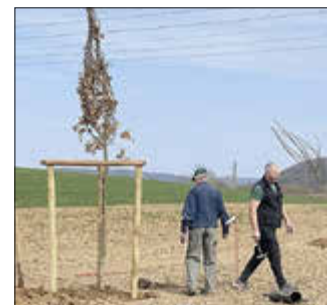
Auf einer Fläche an der Straße zwischen Empfershausen und Körle pflanzten die Helfer neun Laubbäume