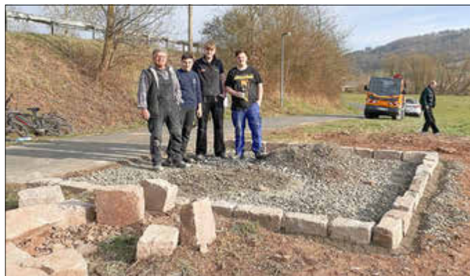
Tatkräftige Hilfe beim Betonmachen und Setzen der Sandsteine ga es hier vom Kirmesteam

Zum Schluss waren alle Helferinnen und Helfer zu einem Imbiss auf den Rathausplatz eingeladen. Jede einzelne Aktion, jede Stunde die von den Einzelnen investiert wurde, trägt dazu bei, dass unsere Orte schöner, unsere Umwelt gesünder wird. Vielen, vielen Dank sagt die Gemeinde Körle für die großartige Hilfe!!!