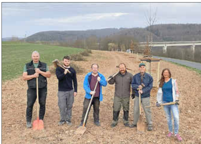
Auf dem Feld wurden außerdem so genannte Benjeshecken aus Gehölzschnitt angelegt, die Tieren einen Unterschlupf bieten