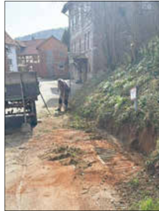
links: In Lobenhäusen wurden diese Regeneinläufe von Gras und Erde befreit