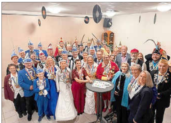
Unser Gäste zum Prinzenempfang 2025