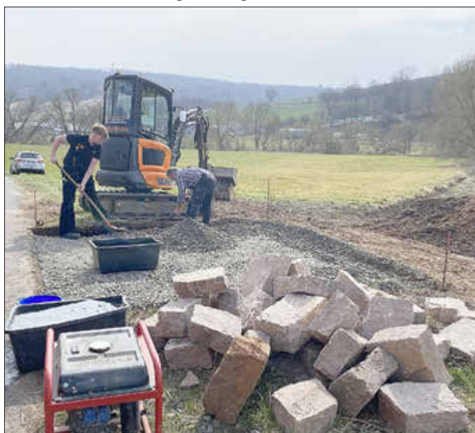
Jochen Knauf und Philip Buhs bereiteten die Fläche vor eine neue Sitzgruppe am Wiesenweg vor