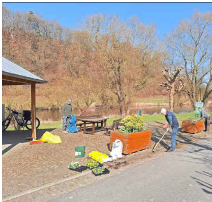
Speckenplatz reinigen, Blumenkübel bepflanzen