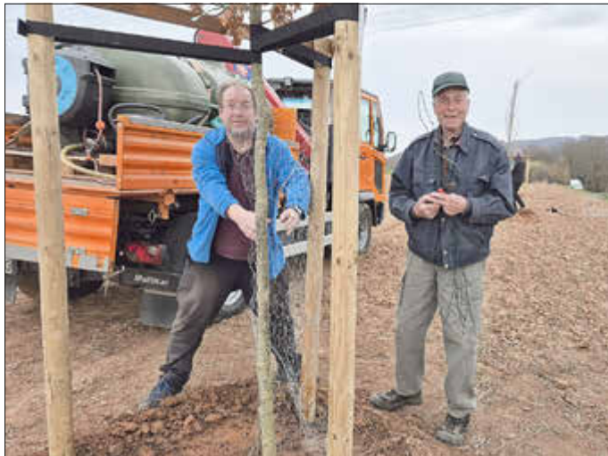
Als Schutz gegen Verbiss oder Scheuern erhielt jeder Baumstamm ein Drahtgeflecht