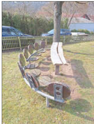
Bank und Tischplatte erneuert auf dem Spielplatz