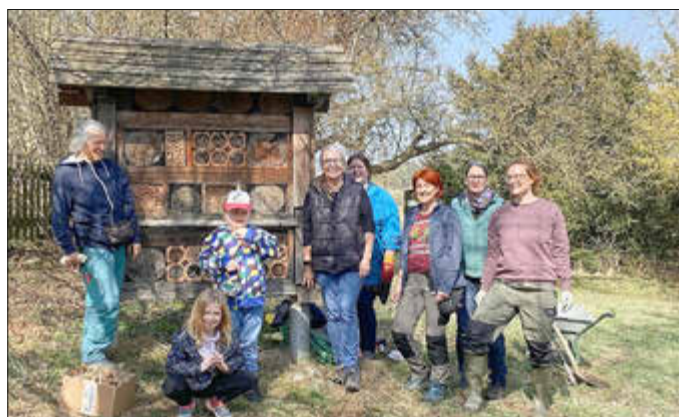
Von der NABU Ortsgruppe wurden an diesem Aktionstag Pflegearbeiten im Naturlehrgarten organisiert