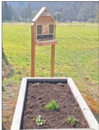
Insektenhotel am Speckenplatz

Die Abteilung Landschaftspflege der Freiwilligen Feuerwehr Büchenwerra und der Ortsbeirat hatte alle Bürger eingeladen um den Winterdreck im und um den Ort zu beseitigen.