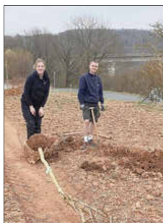
Auch hier war ein Teil des Kirmesteamts dabei