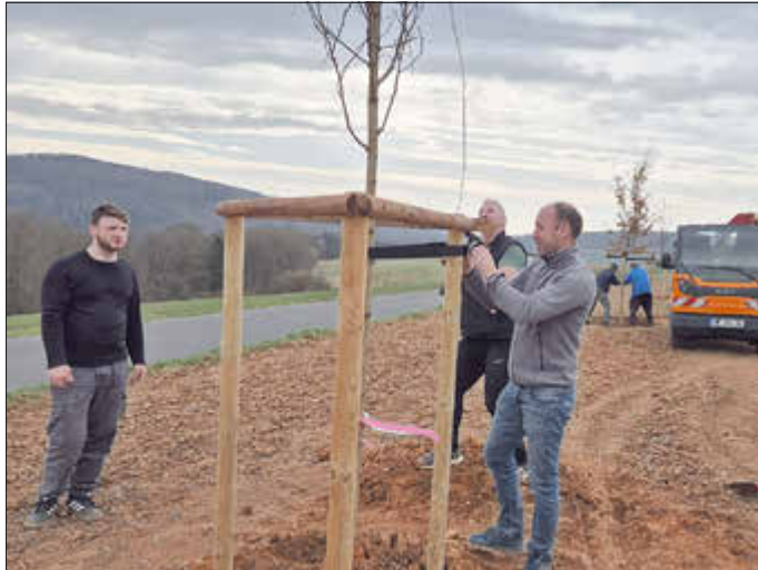
Alle Bäume wurden mit einem Gerüst aus drei Pfählen und Querlatten gesichert, damit die jungen Pflanzen gut anwachsen